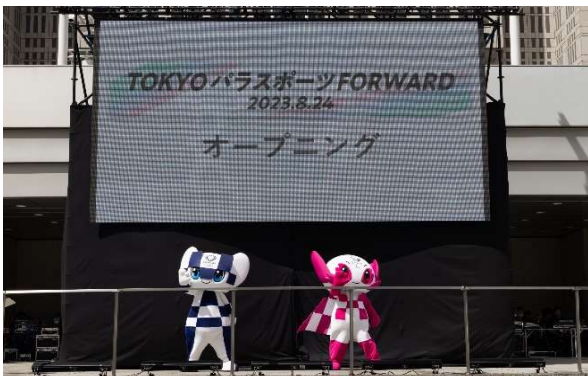
オープニング（都民広場）