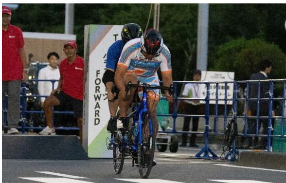
競技デモンストレーション（都庁通り）