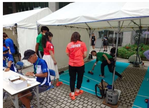
ボッチャ体験（都民広場）