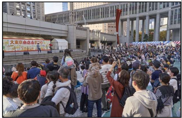
ゲストによるステージライブ