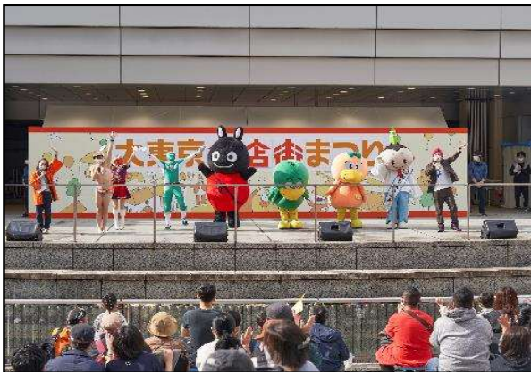
商店街のキャラクターによるショー