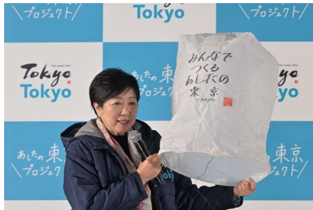
ステージトークショー